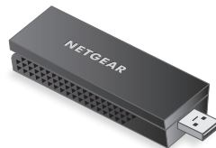
WiFi USB 适配器