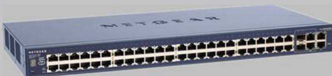
24 个百兆+4 个千兆端口堆叠型智能交换机 FS728TS