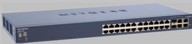
24 个百兆+4 个千兆端口堆叠型智能交换机 FS728TS